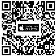
iOS iOS 15 ขึ้นไป