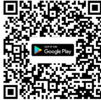
Android Android 8.0 ขึ้นไป